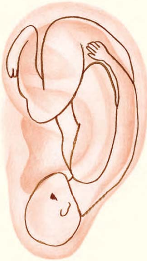
Abbildung des Fötus im Ohr